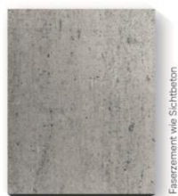
Faserzement wie Sichtbeton