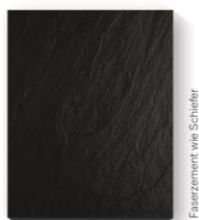
Faserzement wie Schiefer