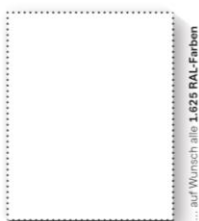
... auf Wunsch alle 1.625 RAL-Farben